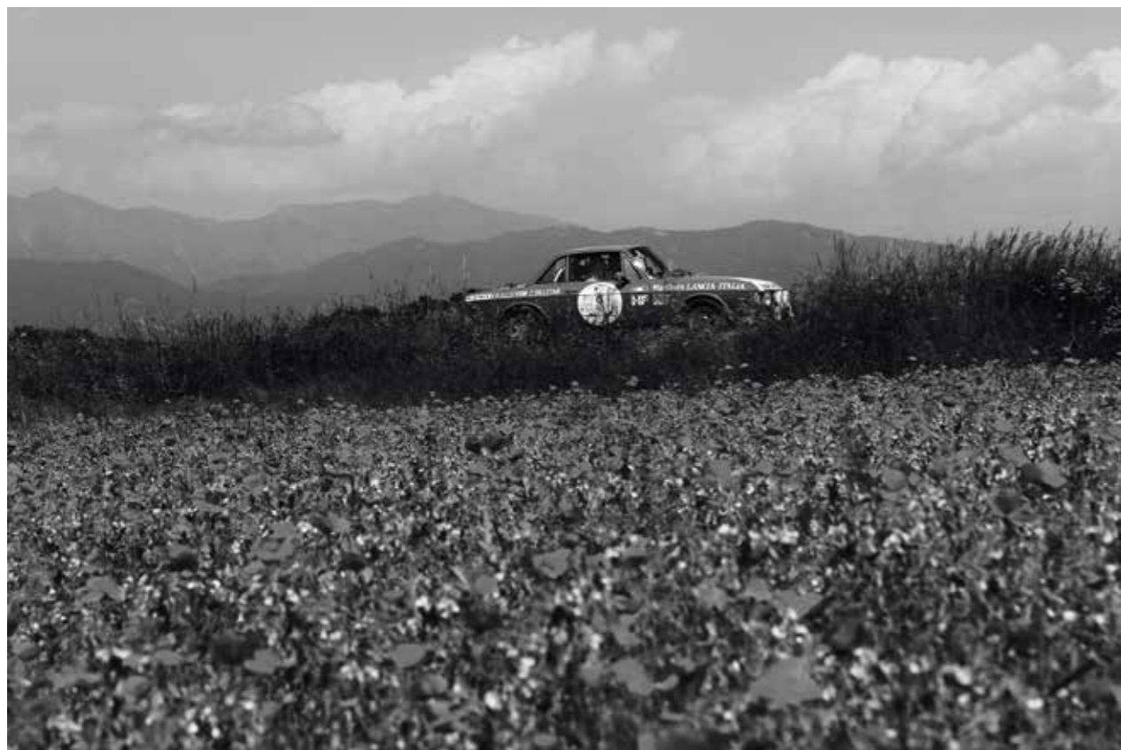
Tour dedicato alle auto da collezione, storiche e di produzione contemporanea organizzato dalla Mitteleuropean Race

dedicata a chi ama segnatempo e gioielli d'epoca, mentre per seguire in maniera professionale la parte contrattualistica dell'evento, l'organizzazione di The One si è avvalsa dell'assistenza di Motu Novu Studio Legale.