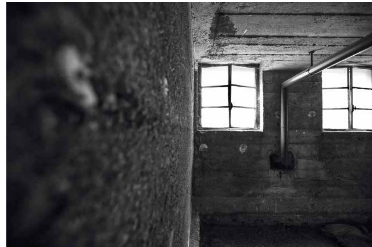
Dettaglio dei cementi originali del 1937